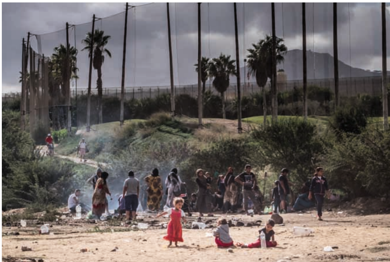
Un gruppo di migranti forzati, con alcuni bambini, vicino al centro di accoglienza di Melilla. Sullo sfondo, un campo da golf protetto da alte recinzioni.