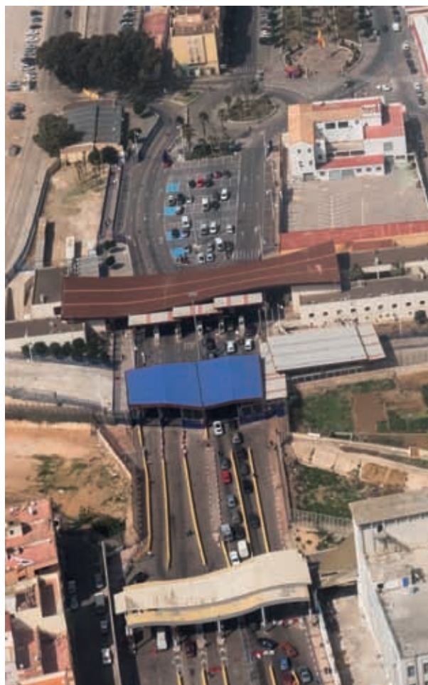
Visione aerea del valico di confine di Beni Enzar, tra la città marocchina di Beni Enzar e l'enclave spagnola di Melilla

affermano di essere state respinte dalle autorità spagnole nelle acque poco al largo di Melilla. Le autorità spagnole e marocchine collaborano regolarmente per evitare che i migranti possano raggiungere le coste di Melilla: le navi della Guardia Civil spagnola bloccano i migranti in mare e la Gendarmeria marocchina li scorta indietro in Marocco. Durante una di queste operazioni, il 31 agosto 2017, sette donne sono morte dopo che il loro barcone si è rovesciato mentre veniva scortato indietro dalle autorità marocchine: questa vicenda è stata riferita al SJM da persone che erano a bordo dell'imbarcazione, ma sono sopravvissute, sebbene siano state sbalzate in acqua.