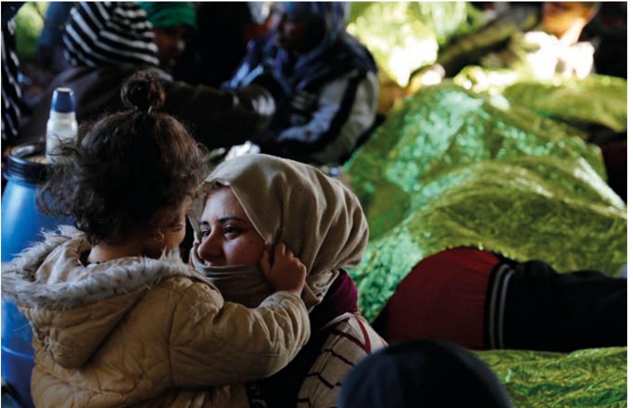
Una madre e sua figlia riposano sul ponte della nave Phoenix, della Ong maltese Migrant Offshore Aid Station (MOAS), pochi giorni dopo essere state soccorse nel Mediterraneo centrale a largo della costa libica, mentre la nave fa rotta verso la Sicilia.