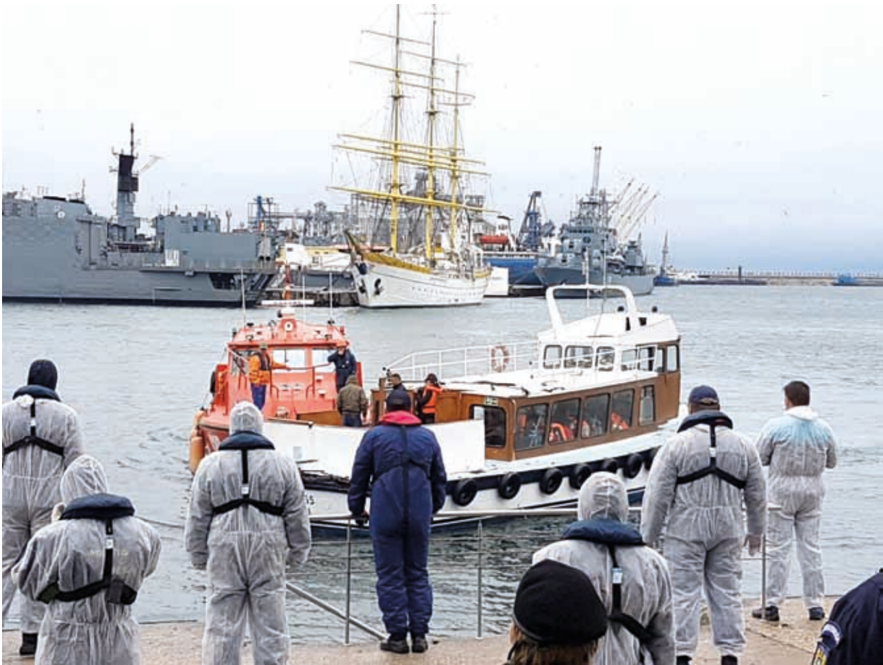
Migranti forzati soccorsi nel Mar Nero in arrivo sulla costa della Romania, dove la Guardia costiera li attende